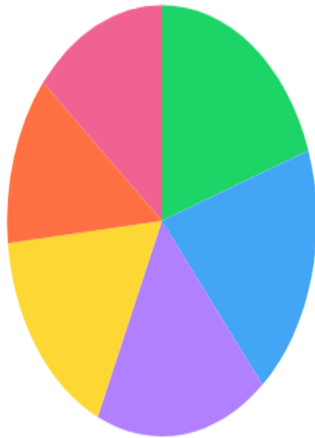
5 อันดับข้อมูลรหัสติด C ทั้งหมด

179 (19.72%) 463 (19.05%) (18.04%) 305 (16.55%) 201 (12.75%) อื่นๆ (13.90%)